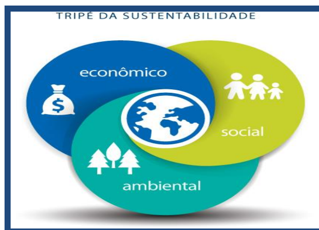
Figura 1 - Tripé da Sustentabilidade proposta pela UNESCO

Fonte: Adaptado pelas autoras: Tripés: Econômico - Promover a excelência e manter padrões éticos de alto nível; Social - Engajamento da comunidade e promoção da responsabilidade social; Ambiental - Desenvolvimento da prática da organização verde e minimizar emissões para o aquecimento global. 2