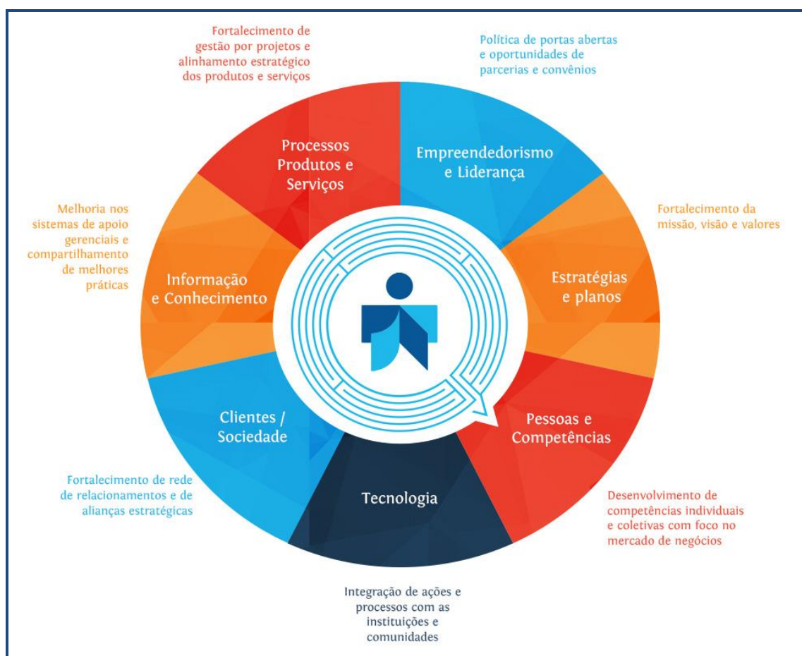
Figura 3 - Dimensões do Website Labirinto do Saber

conhecimento na sociedade contemporânea. Para isso, estabeleceu o espaço “Observatório” composto de uma comunidade de prática e grupo de pesquisa com a participação de pessoas que possam compartilhar interesses comuns e troca de competências e vivências entre os seus participantes, estimulando a aprendizagem e geração de novos conhecimentos. Tendo como aporte essas ações estratégicas, espera-se contribuir para uma articulação efetiva com os gestores das bibliotecas universitárias a fim de adotarem a CoInfo como um parâmetro norteador de sua missão, visão e valores na mediação da informação para a construção de conhecimento junto à comunidade acadêmica.